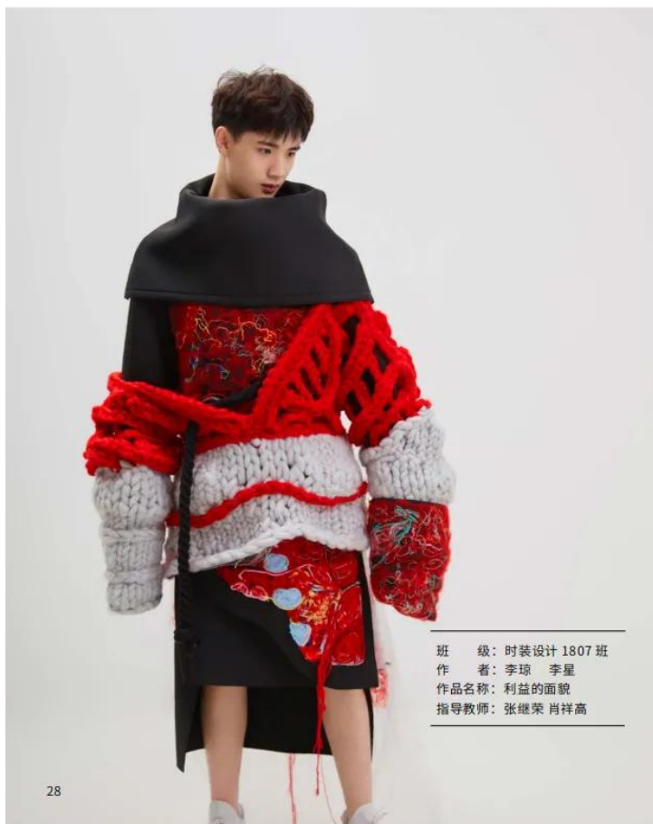
班 级：时装设计 1807 班 作 者：李琼 李星 作品名称：利益的面貌 指导教师：张继荣 肖祥高