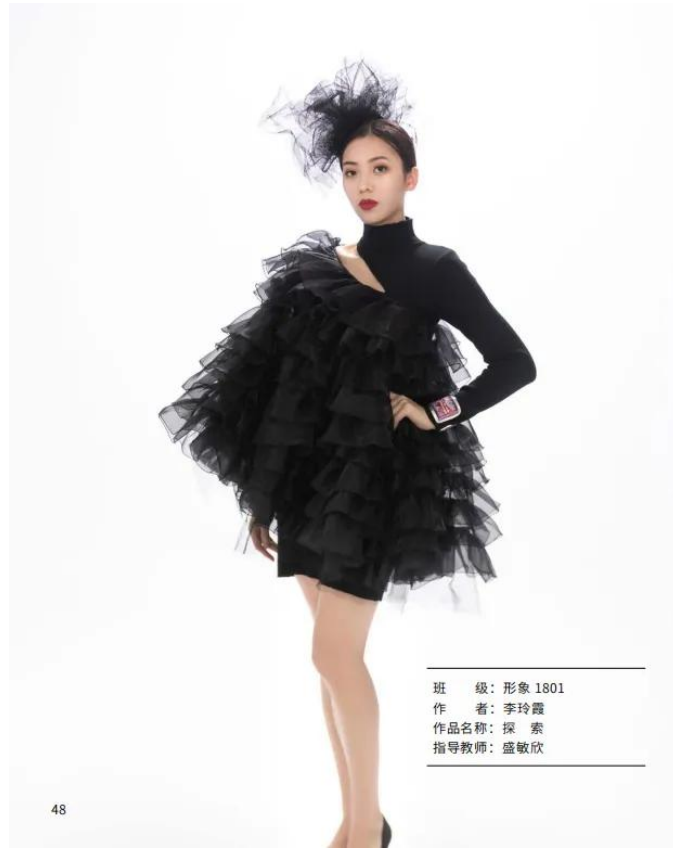
班 级：形象 1801 作 者：李玲霞 作品名称：探 索 指导教师：盛敏欣