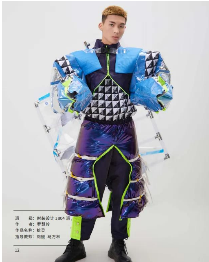
班 级：时装设计 1804 班 作 者：罗慧玲 作品名称：拾灵 指导教师：刘媛 马万林