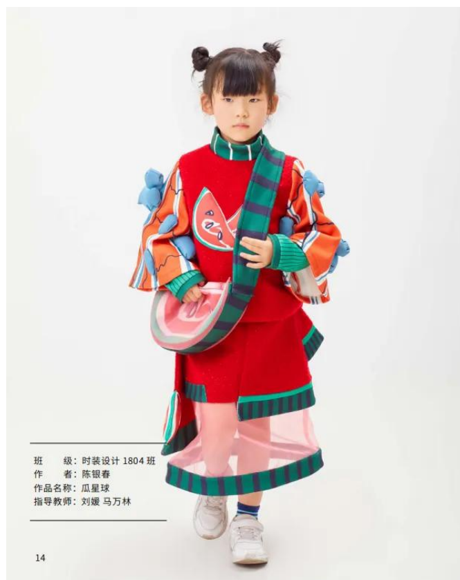
班 级：时装设计 1804 班 作 者：陈银春 作品名称：瓜星球 指导教师：刘媛 马万林