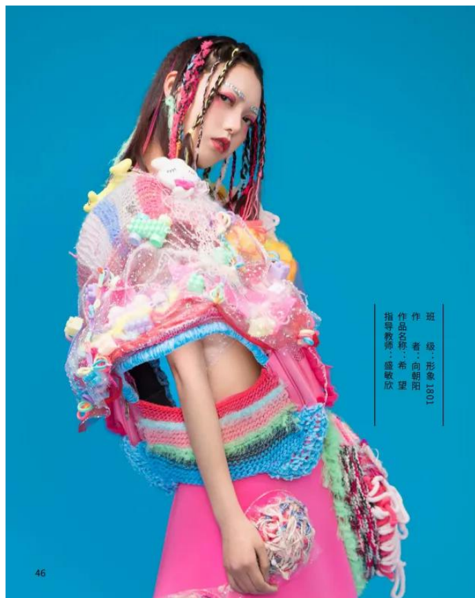
班 级：形象 1301 作 者：向朝阳 作品名称：希望 指导教师：盛敏欣