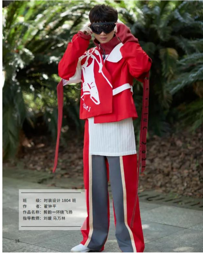
班 级：时装设计 1804 班 作 者：霍钟平 作品名称：剪韵一环绕飞扬 指导教师：刘媛 马万林