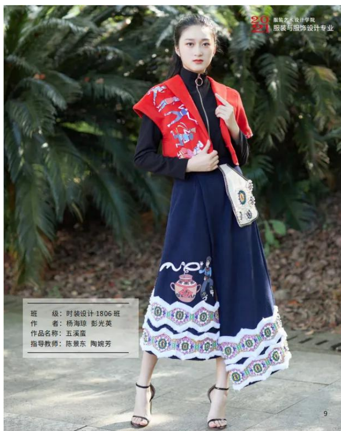
班 级：时装设计 1806 班 作 者：杨海琼 彭光英 作品名称：五溪蛮 指导教师：陈景东 陶婉芳