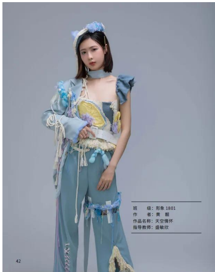
班 级：形象 1801 作 者：黄 靓 作品名称：天空情怀 指导教师：盛敏欣