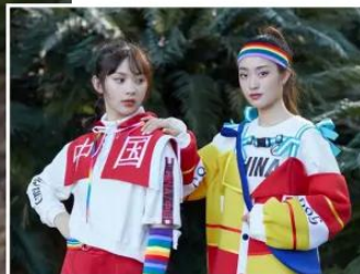
班 级：时装设计 1803 班 作 者：田杰 谭卓 作品名称：荣耀 指导教师：陈彦名 兰岚