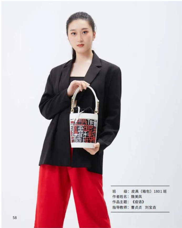
班 级：皮具（箱包）1801班 作者姓名：魏美凤 作品主题：《疫语》 指导教师：曹贞贞 刘宝焱