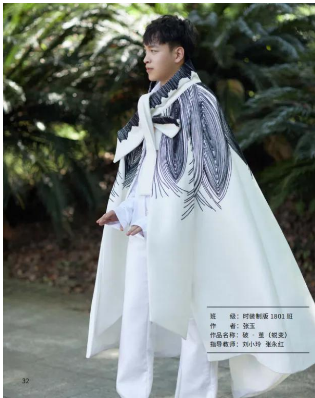
班 级：时装制版 1801 班 作 者：张玉 作品名称：破·茧（蜕变） 指导教师：刘小玲 张永红