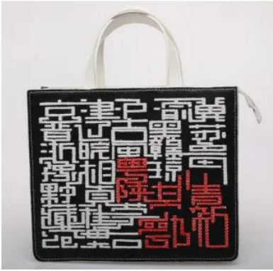
20 服装艺术设计学院 21 皮具艺术设计（箱包）专业