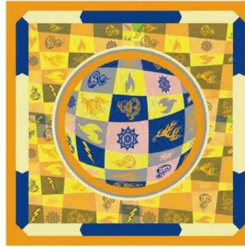
班 级：艺术（纺织）1801 作 者：申缘丰 作品名称：雷火克邪 指导教师：何苗